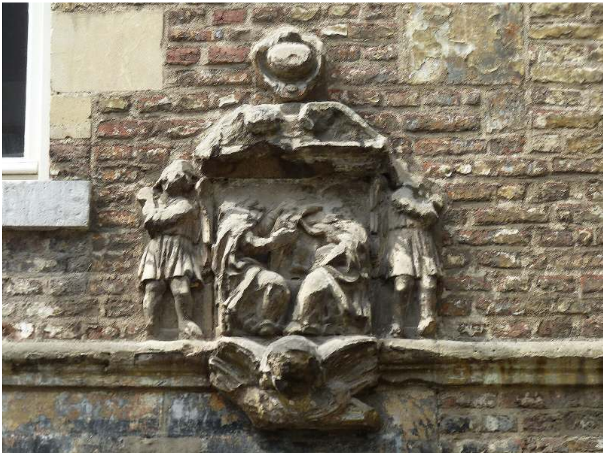
Originele Anna-trits. De meeste figuren helaas 'koploos'. Met (engel?)figuren en een engelekopje als versiering. Is de bekroning boven de voorstelling 'het oog van God'?