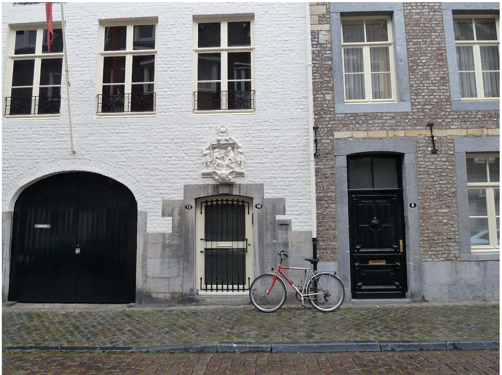
2011, Hospice Saint Jacques; St. Jacobstraat 8-10-12