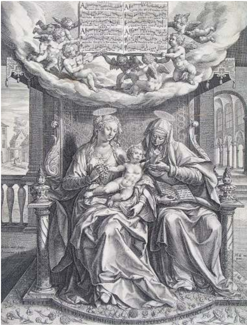
Gravure, Jan Sadeler 1584