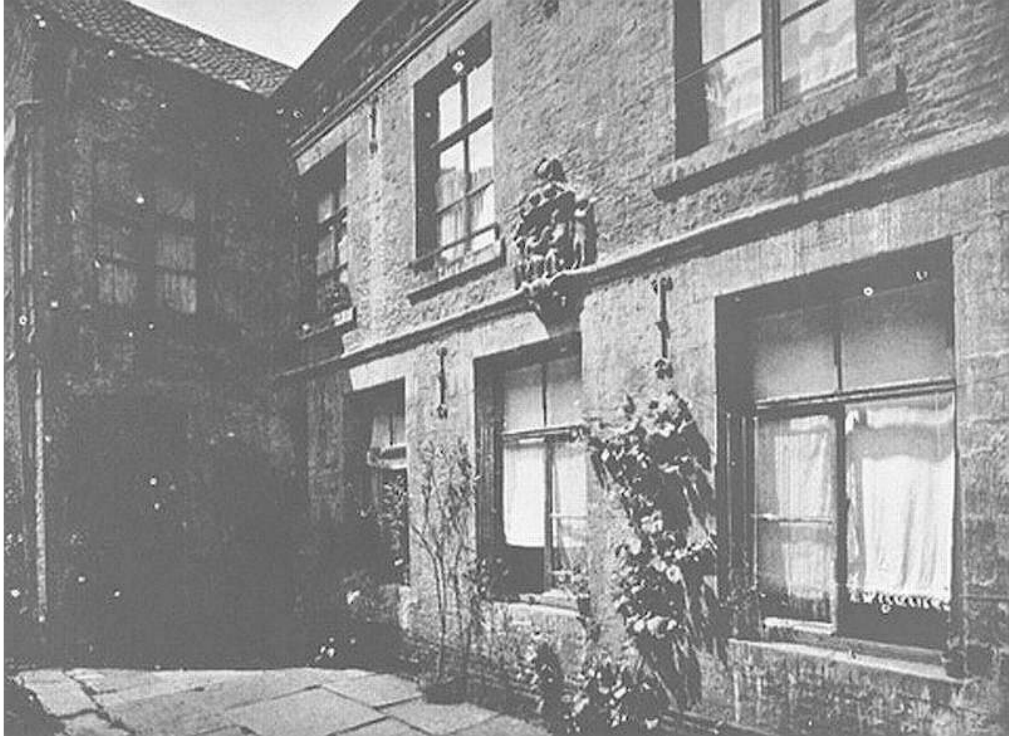
Archieffoto van toen meerdere figuren nog kopjes hadden zoals ook nog te zien is op de replica's die van rond 1950 zijn.