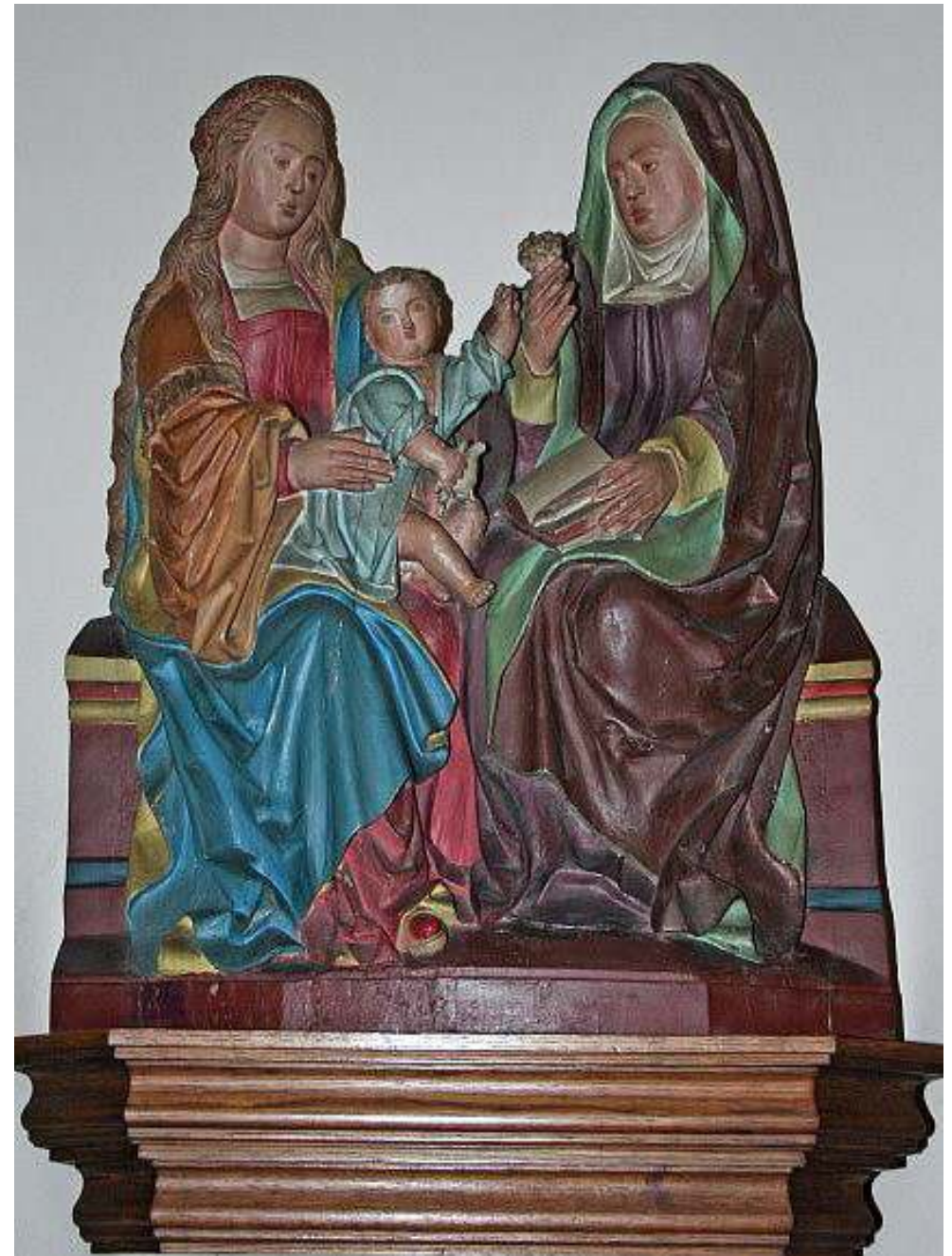
Houten beeld, gepolychromeerd, laat-gotisch, ca. 1500, maker onbekend