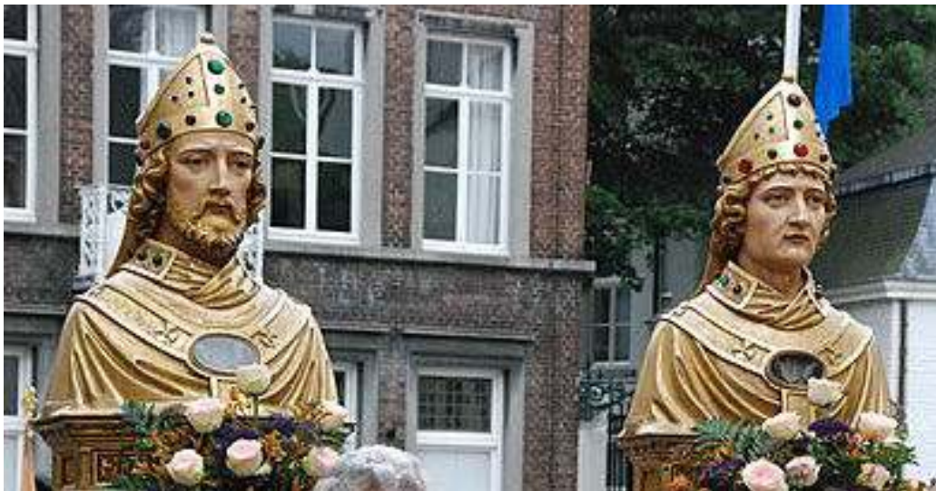
De 'bisschoppentweeling' Monulphus en Gondulphus: - gevelsteen op de Sint Monulphus- en Gondulphuskerk van Berg en Terblijt - de borstbeelden van de twee bisschoppen in de Heiligdomsvaart - de stichters van de Servaaskerk; standbeeld aan het Servaasklooster