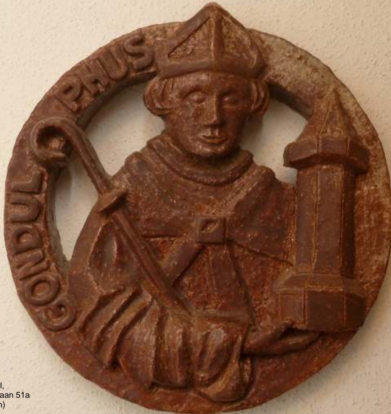
'Logo' vm St. Gondulphusschool, Hertogsingel 98a / El. Strouvenlaan 51a (keramiek; vrij naar de sluitsteen)