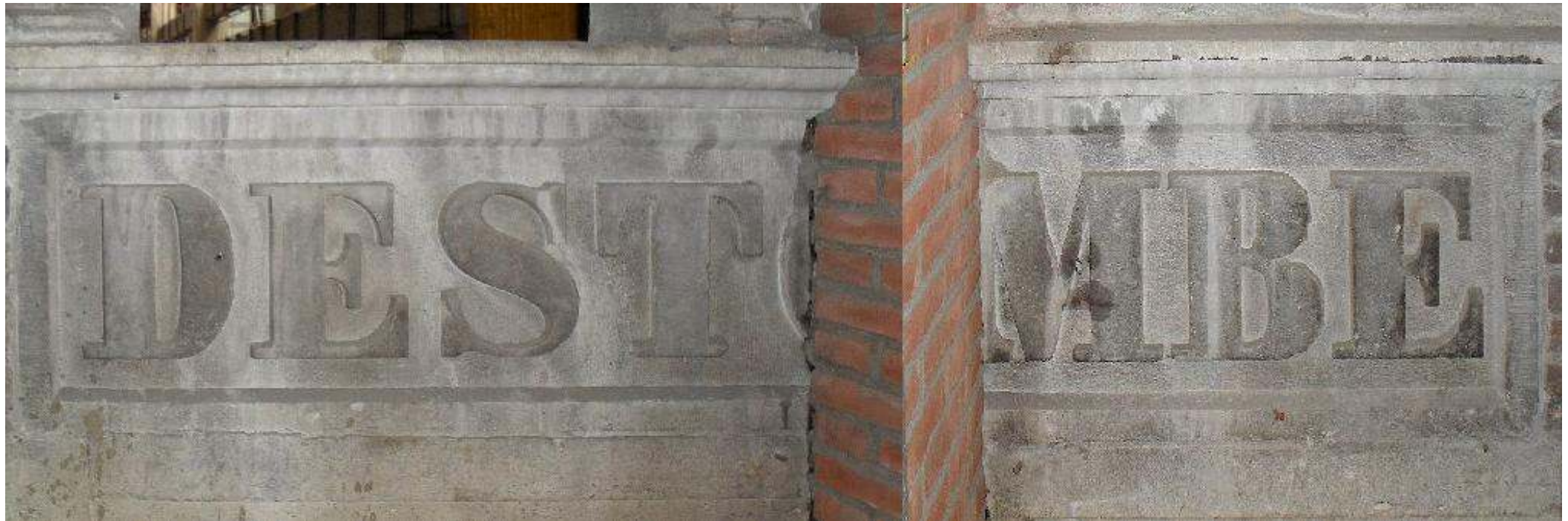
De naamsteen van Destombe bij Sappi in twee keer gefotografeerd links en rechts van de scheidingsmuur en aan elkaar geplakt.