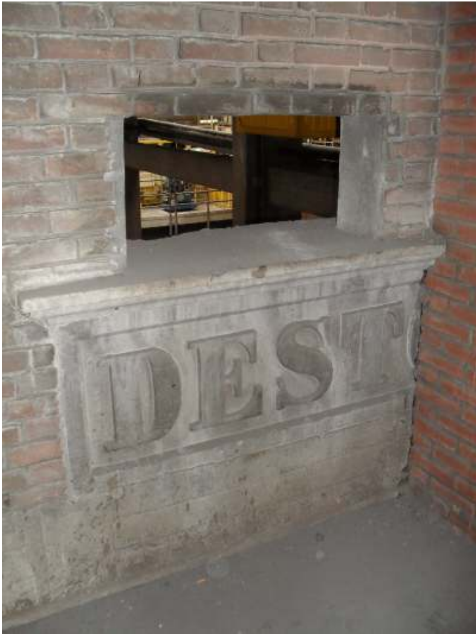
Plaats waar de steen is ingemetseld op de 2e etage achter het huidige cellulosemagazijn. De rechterhelft zit achter de muur die er (later) dwars op geplaatst is.