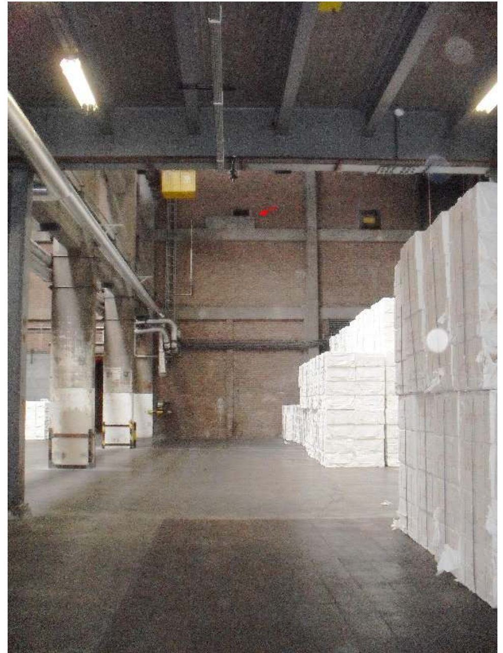
Celluloseopslag van Sappi. De steen.– te dik voor de muur – steekt met de achterkant uit Door het 'kijkgat' boven de steen kijk je uit op de celluloseopslag.